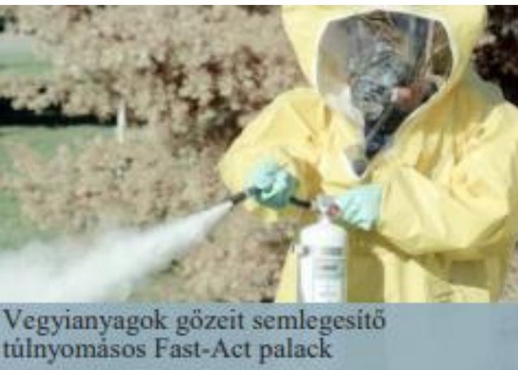
Vegyianyagok gőzeit semlegesítő túlnyomásos Fast-Act palack