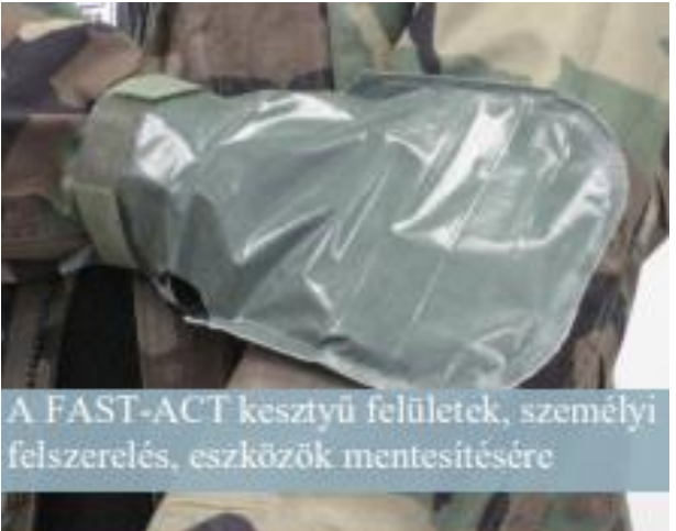
A FAST-ACT kesztyű felületek, személyi felszerelés, eszközök mentesítésére