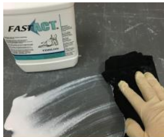
A folyékony FAST-ACT alkalmazása egyszerű: öntse ki és terítse szét.