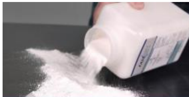
A Fast-Act visszazárható doboz könnyen alkalmazható bármely szennyezett felületre.