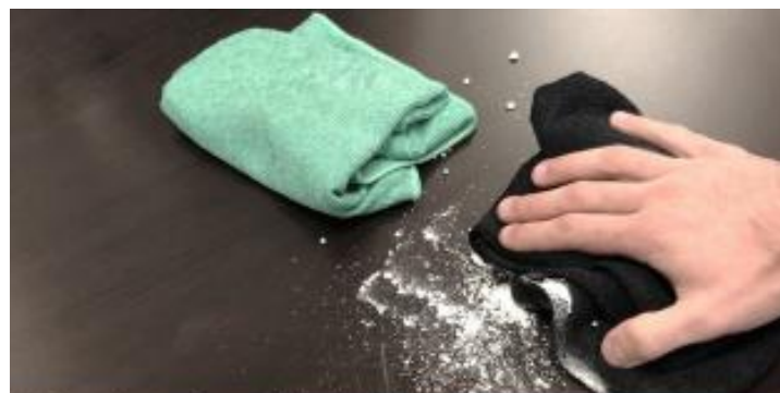
A Fast-Act mikroszálás törölkendő semlegesíti a kiömlött folyékony vegyi anyagokat.